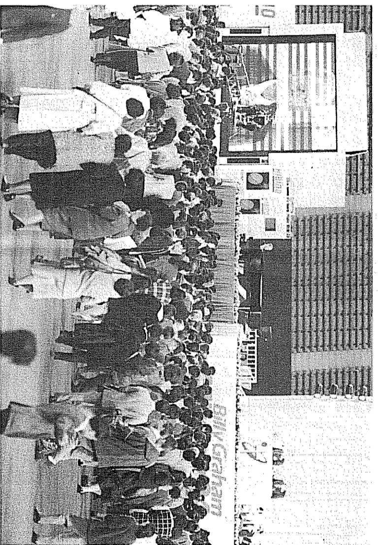
「今、私の生涯をキリストに明け渡します」と、公に主を受け入れたこととを表明した(上)。50年経たず、同じ言葉を語り続けるピリー・グラハム氏のメッセージは愛を感得させない(下)＝1月13日

発行所 クリスチャン新聞 〒101 東京都千代田区神田新富町2-1 電話 3-291-8532(代) FAX 03-5233-4634 大塚支店 〒130 東京都北區大塚5-2-14 03-54-06-0862 FAX 06-54-16-160 発行日 1月10日(祝日を除く)隔週発行 1990年1月23日発行(4日隔週発行) 通巻第 1314号 1紙 200円(送料別) 10紙 1800円(送料別) ●印刷部送料(1紙) 印刷部送料(10紙) 6か月 4,800円 送料(送料別) 13,000円 12か月 9,600円 送料(送料別) 18,000円 24か月 19,200円 送料(送料別) 22,000円 広告費(1日1000字) 1000円(1日1000字) ※各都道府県別送料別記を参照