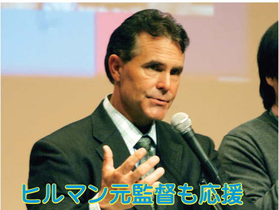
ヒルマン元監督も応援