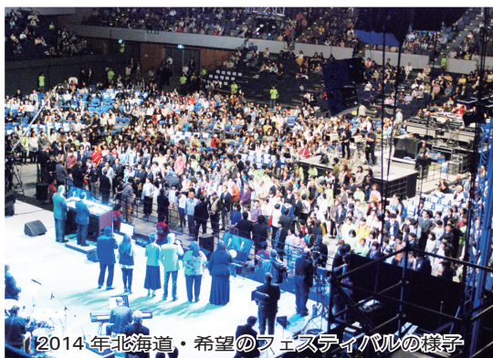
2014年北海道・希望のフェスティバルの様子