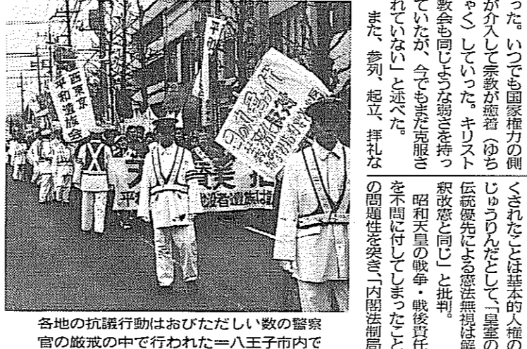
各地の抗議行動はおびただしい。数人の警察官の監視の中で行われた。八王子市内で。

日本基督教団の沖縄教区は、大喪の礼の日に特別礼拝を行った。大喪の礼の日に特別礼拝を行った。大喪の礼の日に特別礼拝を行った。大喪の礼の日に特別礼拝を行った。